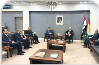
وهزیری شاره‌وانى و گه‌شتوگوزار: پتویسته ناوه‌نده‌کانى توێژینه‌وه هاوشیوهى فێژن كار لەسەر گه‌پاندنى پتویستیه‌یه‌کانى هاولاتیان بکەن