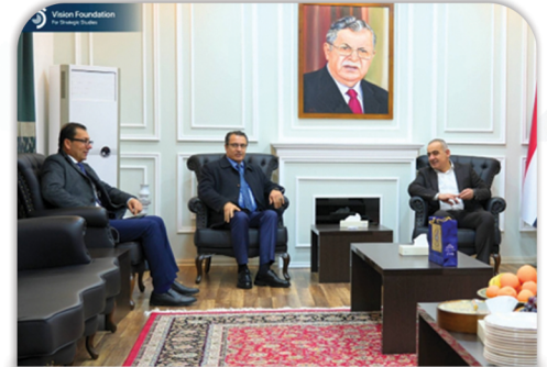
فێژن کۆنفرانسیکی به‌رفراوان بۆ گه‌شه‌پێدانی ئیداره‌ى راپه‌رین ئەنجام ده‌دات