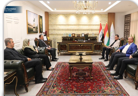
دامەزرەوی فێژن کار لەسەر به‌هێزکردنى ئابوورى شارى سلێمانى ده‌کات