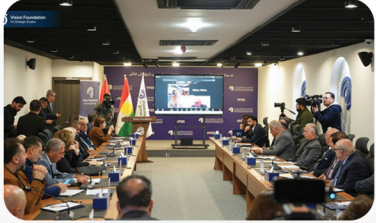
بیلایه‌نئی عیراق و هه‌ریمی کوردستان له‌ جه‌نگی ئەمیریکا و ئیسرائیل به‌رامبه‌ر ئێران له‌ژێر پرسیاردایه

روژی 2026/3/12 دامه‌زراوه‌ی فیژن گفتوگۆیه‌کی کراوه، به‌ ئاماده‌بوونی پسیۆر و شاره‌زایانی سه‌ربازی و سیاسی و به‌ به‌شداری ناوه‌نده‌کانی لیکۆلینه‌وه‌ی رواق و نه‌هره‌ین له‌ به‌غداد و ناوه‌ندی لیکۆلینه‌وه‌ی روداو له‌ هه‌ولێر و ناوه‌ندی لیکۆلینه‌وه‌ی هه‌ریمی له‌ زانکۆی موسڵ له‌ رێگه‌ی زوممه‌وه، ئەنجامدا. له‌ گفتوگۆکه‌دا چه‌ختکرایه‌وه، که‌ بژاردی بیلایه‌نی که‌ ئیستا له‌لایه‌ن عیراق و هه‌ریمی کوردستانه‌وه‌ باسی لێوه‌ده‌کرێت، ته‌نها له‌چوارچێوه‌ی راگه‌یه‌ندراوايه، چونکه‌ عیراق و هه‌ریمی کوردستان په‌لکێشده‌کرێته‌ ناو ئەم جه‌نگه‌وه‌ به‌ی ویستی خۆی.