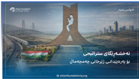
Hawala And Informal Money Transfer Systems Regulatory and Security Implications