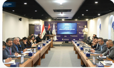
پێویسته‌ دامه‌زراوه‌کانی تووژینه‌وه‌ و ده‌زگا میدیاییه‌کان هه‌ماهه‌نگی زیاتریان هه‌بیت

روژی 2026/3/12 دامه‌زراوه‌ی فیژن گفتوگۆیه‌کی کراوه، به‌ ئاماده‌بوونی پسیۆر و شاره‌زایانی سه‌ربازی و سیاسی و به‌ به‌شداری ناوه‌نده‌کانی لیکۆلینه‌وه‌ی رواق و نه‌هره‌ین له‌ به‌غداد و ناوه‌ندی لیکۆلینه‌وه‌ی روداو له‌ هه‌ولێر و ناوه‌ندی لیکۆلینه‌وه‌ی هه‌ریمی له‌ زانکۆی موسڵ له‌ رێگه‌ی زوممه‌وه، ئەنجامدا. له‌ گفتوگۆکه‌دا چه‌ختکرایه‌وه، که‌ بژاردی بیلایه‌نی که‌ ئیستا له‌لایه‌ن عیراق و هه‌ریمی کوردستانه‌وه‌ باسی لێوه‌ده‌کرێت، ته‌نها له‌چوارچێوه‌ی راگه‌یه‌ندراوايه، چونکه‌ عیراق و هه‌ریمی کوردستان په‌لکێشده‌کرێته‌ ناو ئەم جه‌نگه‌وه‌ به‌ی ویستی خۆی.